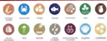
TABLA DE LOS 14 ALÉRGENOS